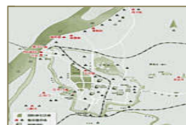
侵华日军南京集体屠杀场地图