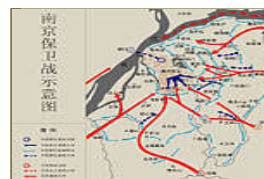
南京保卫战示意图