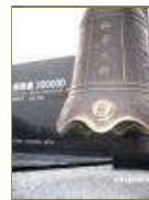
遇难同胞纪念馆新馆