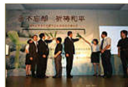
南京大屠杀史实网站开通