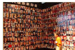
侵华日军南京大屠杀史实展