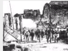
虎贲之师：八千男儿血的 常德会战

刊用本网站稿件，务经书面授权。未经授权禁止转载、摘编、复制及建立镜像，违者依法必究。