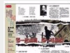
血战常德虎贲师：士兵替 百姓割稻子只许喝茶