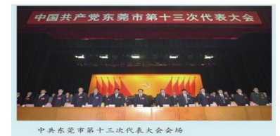
中共东莞市第十三次代表大会