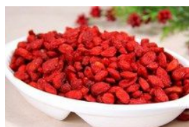
枸杞一次吃多少最养生