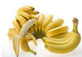
香蕉的12大神秘功效