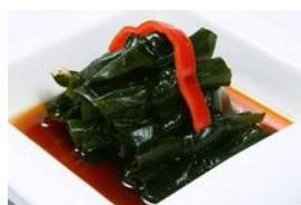
海带的9大神奇养生功效