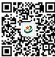
中国军网微信 公众号

据悉，民革中央在2016年编辑出版了两岸共写抗战史系列丛书的第一部《长城与抗战》，在海外引起热烈反响，受到两岸社会各界广泛赞誉。系列丛书第二部《长江与抗战》正在编辑出版中，预计不久后面世。丛书编辑过程中，两岸共同搜集史料，有力增进了两岸同胞的民族归属感与责任感。(完)