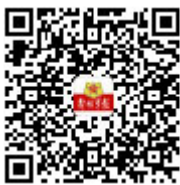
解放军报安卓 客户端