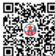
钧正平工作室 公众号