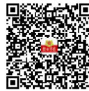
解放军报苹果 客户端