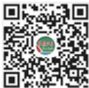
解放军报微信 公众号