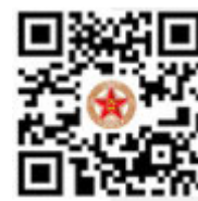
解放军报微博 公众号