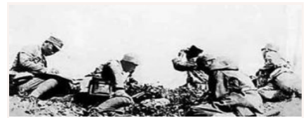
八路军第一一五师的著名战斗