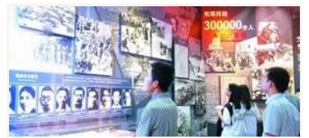
忆昔抚今 重温抗战精神

抗战胜利70周年主题展览开幕 抗战馆专场三天已接待超万人 文物背后的抗战硝烟 纪念抗战胜利主题展将展出照片1170幅文 我军将开展系列活动纪念抗战胜利70周年