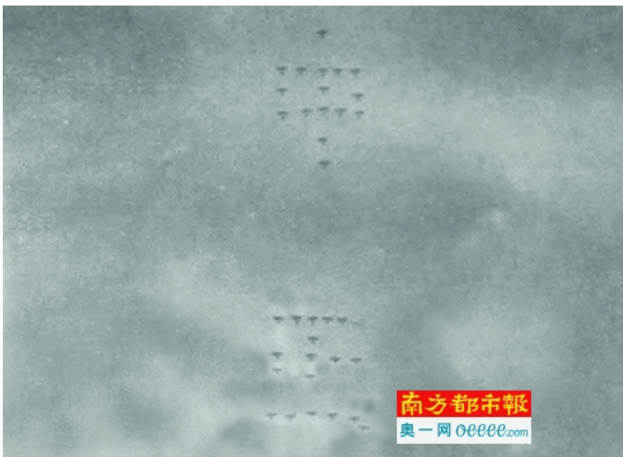
蒋介石寿辰献机典礼上，飞机排成“中正”二字。