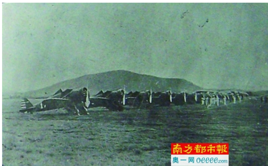
广东各界捐献并命名的全部十八架飞机。