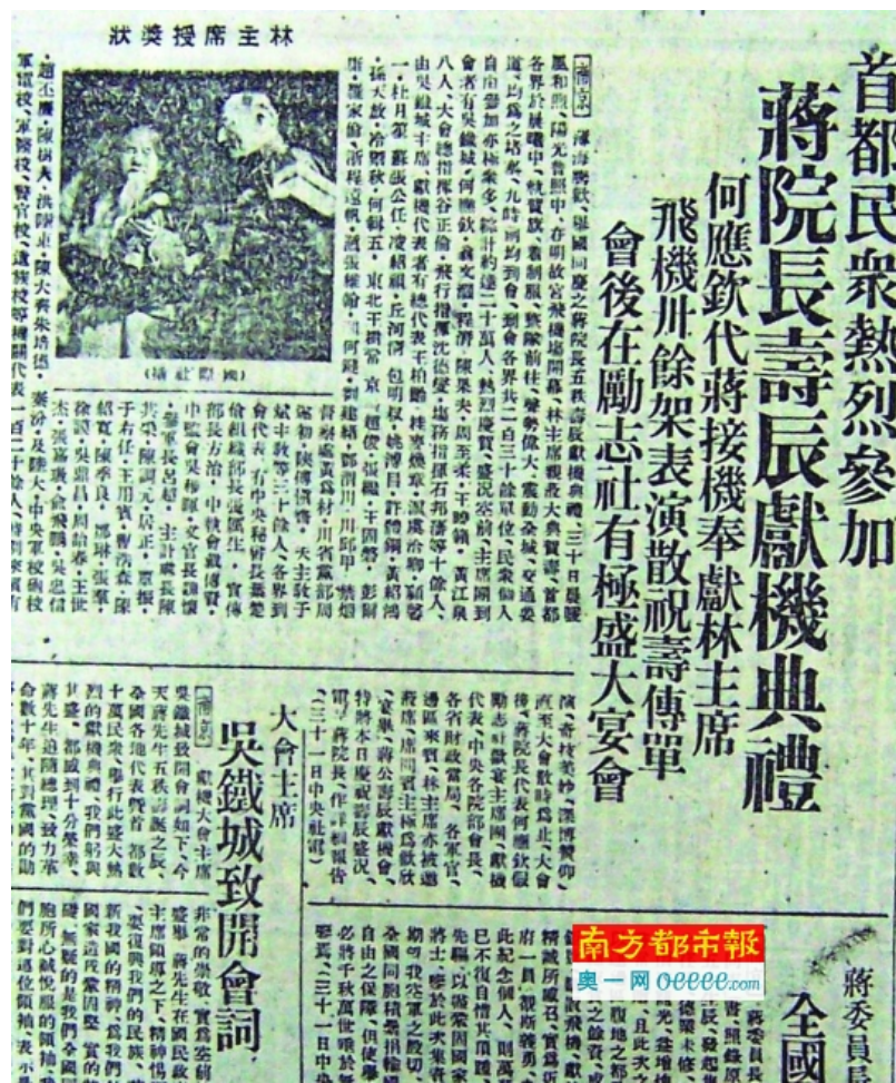
《申报》1936年11月1日关于蒋介石寿辰献机典礼的报道。

抗战时期中国空军的飞机无论在数量上还是质量上都远远比不上日本空军，因而战争的制空权一直掌握在日军手中。八年抗战乃至十四年抗战期间，敌机到处肆虐逞凶，频繁轰炸我前方阵地和后方无辜居民。在此情况下，海内外华人纷纷捐款购买飞机献给国家，以期保家卫国，实现“航空救国”之梦。