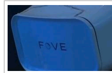
日本：虚拟现实设备可用眼睛控制