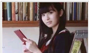
日本最美交换生长相清纯甜美走红 (图)