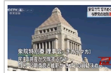
日本众议院15日表决新安保法案