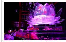
日本唯美艺术展: 金童在莲花池中梦幻舞动(图)