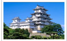
【日本旅游】兵庫県姫路城