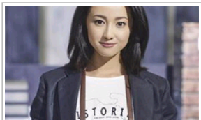
日剧迷票选春季日剧人气演员 泽尻英龙华最受关注