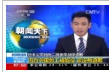
日本：一公司将向二战美军战俘道歉