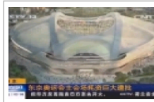
日本：东京奥运会主会场 耗资巨大遭批