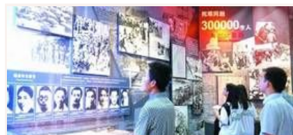
忆昔抚今 重温抗战精神

抗战胜利70周年主题展览开幕 抗战馆专场三天已接待超万人 文物背后的抗战硝烟 纪念抗战胜利主题展将展出照片1170幅文 我军将开展系列活动纪念抗战胜利70周年