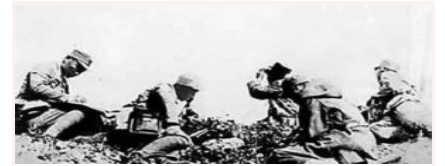
八路军第一一五师的著名战斗