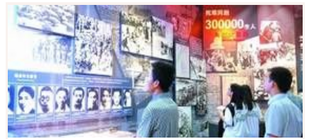
忆昔抚今 重温抗战精神

抗战胜利70周年主题展览开幕 抗战馆专场三天已接待超万人 文物背后的抗战硝烟 纪念抗战胜利主题展将展出照片1170幅文 我军将开展系列活动纪念抗战胜利70周年