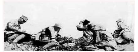
八路军第一一五师的著名战斗