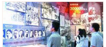
忆昔抚今 重温抗战精神

抗战胜利70周年主题展览开幕 抗战馆专场三天已接待超万人 文物背后的抗战硝烟 纪念抗战胜利主题展将展出照片1170幅文 我军将开展系列活动纪念抗战胜利70周年