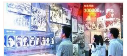
忆昔抚今 重温抗战精神

抗战胜利70周年主题展览开幕 抗战馆专场三天已接待超万人 文物背后的抗战硝烟 纪念抗战胜利主题展将展出照片1170幅文 我军将开展系列活动纪念抗战胜利70周年