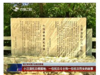
铭记来时路 弘扬抗联魂 小汪清抗日根