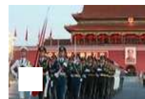
庆祝新中国69岁华诞 天安门广场举行升旗仪式