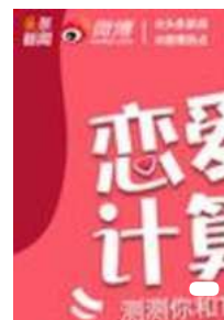
恋爱计算器 算算你的