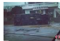
“潭美”袭击日本 大巴车被掀翻