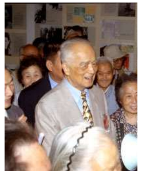
梁灵光参观南通博物苑照片 2000年10月梁灵光率新四军地重游，来到南通，参观《南通博物苑馆藏革命文物史料》热烈欢迎。