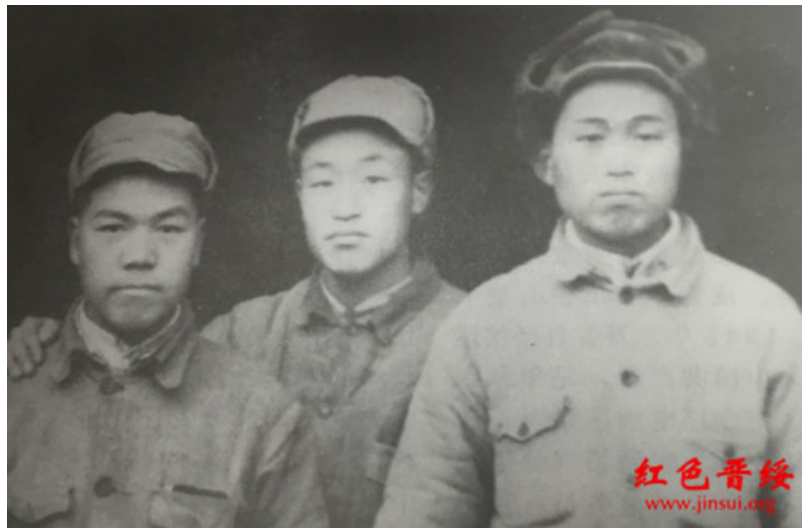
1949年在离石（梁峰）与战友合影。

新中国成立后转业到地方工作，曾任平遥县木材公司人事科长，山西木材公司人事科副科长，中央劳资训练班大连化工厂劳资科长，太原化工厂劳资科长，太原中原玻璃厂厂长，太原市委工交组工业本公室、经委地工处副主任，副处长等职。1986年离休，1995年3月9日在太原逝世，终年70岁。