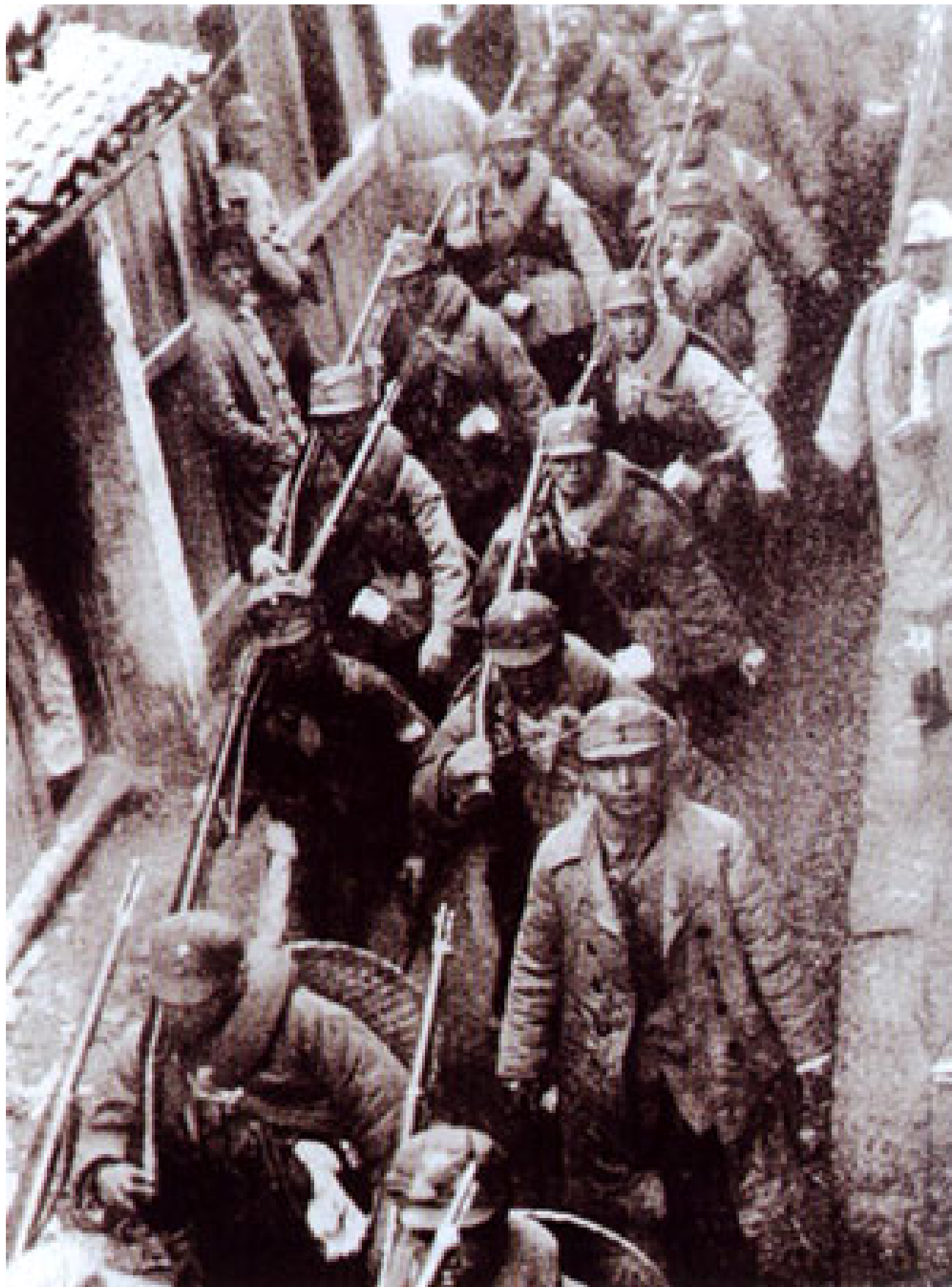
中国将士穿过上海小巷开往战场