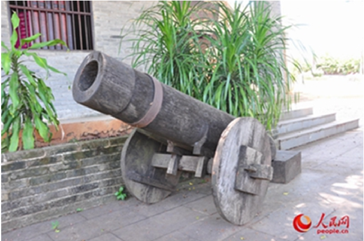
资料图：陈列于南阳人民革命斗争纪念馆外的荔枝炮仿制品。

海南省文昌南阳地区（原南阳乡，现文昌市文城镇南新村、南联村一带）是著名的“抗日模范乡”，抗日坚决，群众基础牢固，军民一致，堪称典范。记者近日采访时，除了被当地可歌可泣的英雄事迹和抗日杀敌的好儿郎感染，还发现了3件闻所未闻的“抗日神器”：荔枝炮、箭毒木、毒鱼藤。