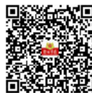
解放军报苹果 客户端