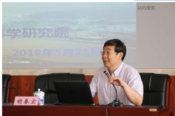
胡春宏院士作报告

5月21日, 我院举办了第21期“鄱水论坛”。本期论坛特邀中国工程院院士、中国水利水电科学研究院副院长胡春宏院士作“江湖关系变化与长江大保护”的报告。论坛由胡建民院长主持, 省水利厅厅长罗小云、副厅长吴义泉, 省鄱建办副主任纪彬, 省水利厅、省鄱建办相关处室负责同志和业务骨干, 院领导吴晓彬、雷声, 以及省水文局、省水利规划设计研究院及我院专业技术人员共130余人参加论坛。