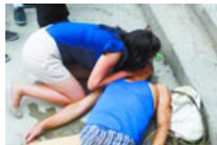
女子为溺水老人人工呼吸感动网友