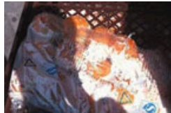
网曝麦当劳汉堡原料面包包装破损