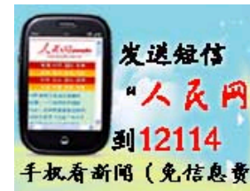
发短信上手机人民网