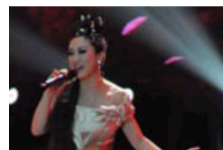
网络红人芙蓉姐姐开演唱会