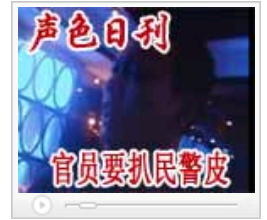
官员遭遇执法要扒民警皮