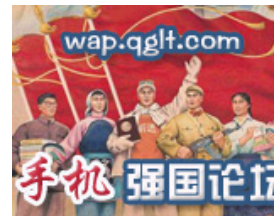
手机上网就上强国论坛