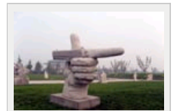
孙子雕塑园令人开眼