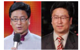
白岩松获激扬文字奖