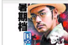
暑期档国片表现平平该怨谁