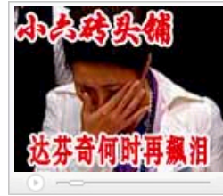
达芬奇何时再飘泪?