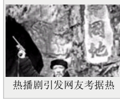
热播剧引发网友考据热