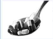
减肥药——女性便秘的罪魁祸首