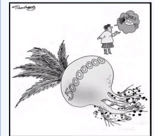
拔出萝卜带出“你”(附漫画)