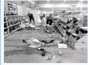
“地震又一次发生, 我烦了”