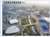
伦敦奥运村建设完成90%