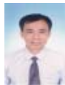
王驹(1950 - ),男,博士,研究员,主要研究领域为描述逻辑,数理逻辑,人工智能.