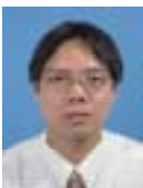
蒋运承(1974 - ),男,广西桂林人,博士,副教授,主要研究领域为描述逻辑,语义 Web,Web 智能.