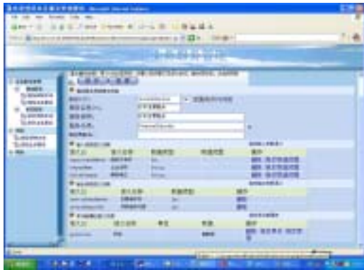
Fig.2 Service community