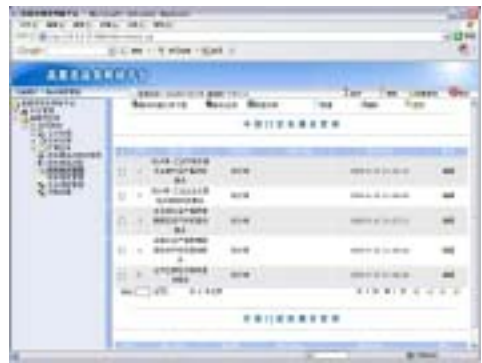
Fig.5 A cost effective grid-enabled eGovernment system 图 5 高要市低成本电子政务网格平台

在实际项目中的使用情况表明:CAFISE Framework 及基于该框架的面向服务的开发方法能够较好地解决由资源及需求动态变化引起的软件适应性问题,支持面向服务应用的快速构建.