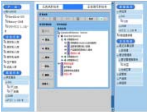
Fig.4 Advanced manufacture grid 图 4 先进制造网格 AmGrid

除了网络科技资源整合示范项目之外,我们还在奥运综合信息服务系统、先进制造网格项目 AmGrid(如图 4 所示)、高要市低成本电子政务网格平台(如图 5 所示)项目中使用了本文所述的框架和开发方法.