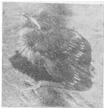
图 3 白头鹤的幼鸟

关于雏鸟的生长发育情况,曾对4号巢中的一只幼雏,在育雏后的第1、3、5、7、9五天,于每日上午8时进行了拍照(见图3)。