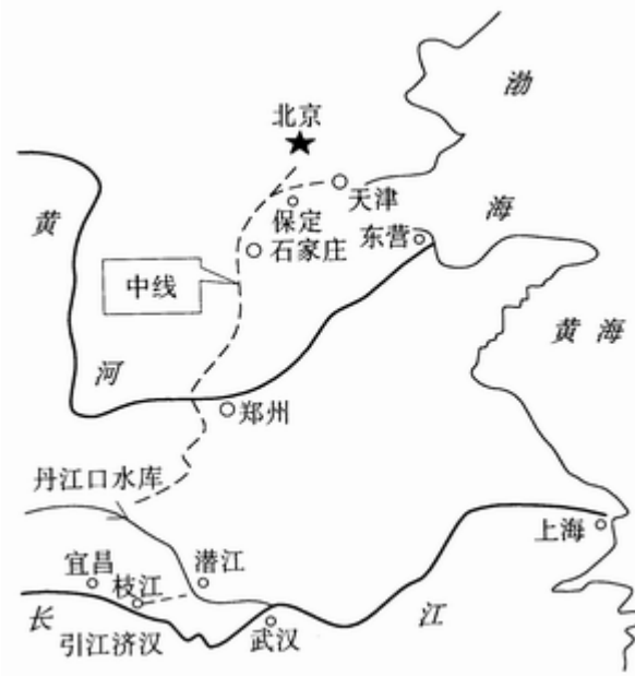
图1 南水北调中线工程与引江济汉工程位置关系