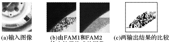
图 2 实验结果

2) 图 1 中(a)图像的上半部分(含 32 \times 64 个像素点)分别作为一个训练模式对的前件和后件, 由左、右图像的下半部分构成另一训练模式对, 并构建一个分别含有 32 \times 64 个输入、输出节点的 Max-Product FAM1。类似地由图 1(b), 能得到另外的两个训练模式对和 Max-Product FAM2, 并采用文献[10]的学习算法训练两网络。