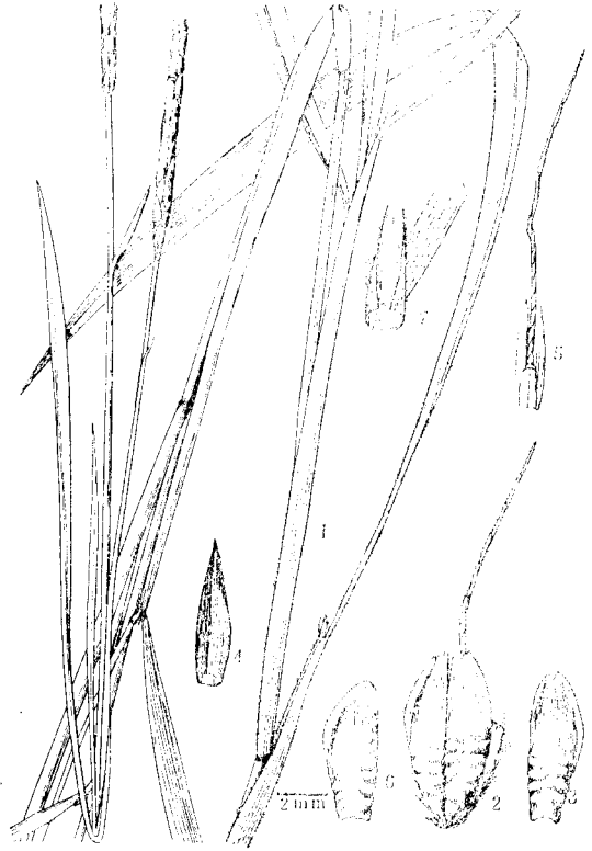
图2 圆柱鸭嘴草 Ischaemum cylindricum Keng et Zhao sp. nov. 1. 植株; 2. 小穗; 3. 第一颖; 4. 第二颖; 5. 第二外稃 (3—5 属于无柄小穗); 6. 有柄小穗的第一颖; 7. 叶舌。

Hainan: Fu shan (福山) Fu-Min farm (福民农场), coffee garden, prope aquam crescit. 24 XI 1950 (Typus in Guangxi Institute of Botany, No 24797). (Another specimen in South China Institute of Botany, Academia Sinica, No. 144)