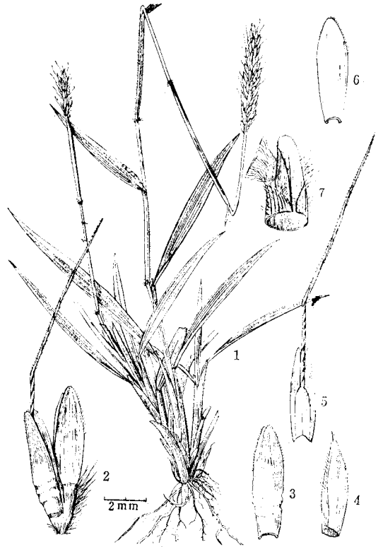
图 4 天台鸭嘴草 Ischaemum tientaiense keng et Zhao, sp. nov. 1. 植株; 2. 小穗; 3. 第一颖; 4. 第二颖; 5. 第二外稃 (3—5 属于无柄小穗); 6. 有柄小穗的第一颖; 7. 叶舌。

多年生; 秆成疏丛, 基部膝曲, 高 16—33 厘米, 基部分枝, 节有髯毛; 叶鞘疏松包秆, 密生疣基毛, 基部的或可无毛; 叶片线状披针形, 先端渐尖, 基部略狭, 长 2.6—9.6 厘米, 宽 3.5—5 毫米, 两面均有短密毛; 叶舌厚膜质, 先端弧形, 红褐色, 长 1.5—