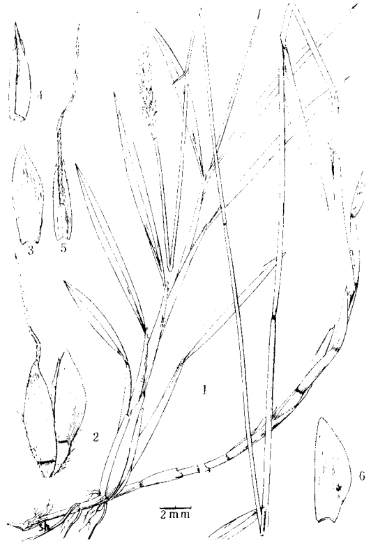
图5 云南鸭嘴草 Ischaemum yunnanense Keng et Zhao sp. nov. 1. 植株; 2. 小穗; 3. 第一颖; 4. 第二颖; 5. 第二外稃(3—5属于无柄小穗); 6. 有柄小穗的第一颖。

Perenne; culmi simplices, interdum ramosi, erecti vel basi repentes, e nodis radices facile emittentes, 44—78 cm alti. 3—14 nodes; nodo glabro; foliorum vaginae laxae amplexicales, internodiis longiores vel superiores breviores, superne tuberculato-pilosae vel prope marginem ciliatae; laminae planae, lineari-lanceolatae, 3.1—9.6 cm longae, 2—7 mm latae, setacea-acuminatae, margine scabrae, utrinque pilosae; ligula membranacea, obtusa, lateraliter pilis longis basi tuberculatis praedita, 2—3 mm longa; racemi gemini circ. 4.5 cm longi, arcte adpressi; articuli rhacheos 4.5—5.6 mm longi, crassissimi, trigoni, angulo exteriori albo-ciliati, interiore glabri; spiculae sessiles oblongo-lanceolatae, late-