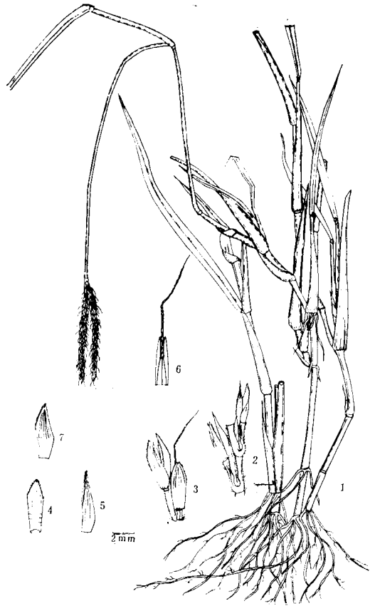
图1 广西鸭嘴草 Ischaemum guangxiense Zhao, sp. nov 1. 植株; 2. 小穗; 3. 第一颖; 4. 第二颖; 5. 第二外稃 (3—5 属于无柄小穗); 6. 有柄小穗的第一颖。

Guangxi: Lin-Gui (临桂) aro-und Yan-shan (雁山) 24 VI 1953, Xu Yue-bang (徐月邦) 10500 (Typus in Gunangxi Institute of Botany,