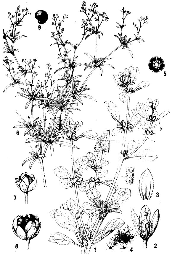
图3, 1—5 星粟草 Glinus lotoides L. 1. 植株 2. 花展开; 3. 萼片; 4. 星状毛; 5. 子房横切; 6—9 粟米草 Mollugo pentaphylla L. 6. 植株 7. 花; 8. 果; 6. 种子。(曾孝濂绘)