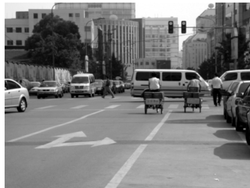
图4 金融街地区改建后的街道、两侧建筑