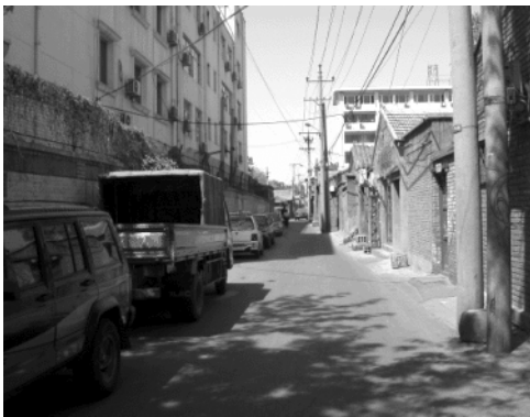
图1 德内地区的护国寺东巷