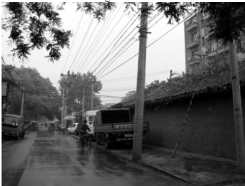
图2 德内地区的护国寺街