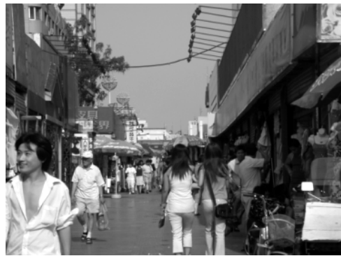
图3 隆福大厦前胡同