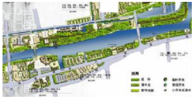
图7 西段局部的绿地规划

3.6 发展旅游——延伸城墙价值 不断提高的物质文化生活水平给人们带来了深度旅游的需求。结合城墙资源,发展