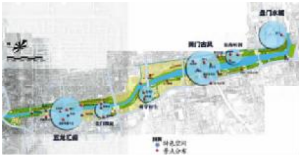
图2 环古城西段的空间特色和景点分布