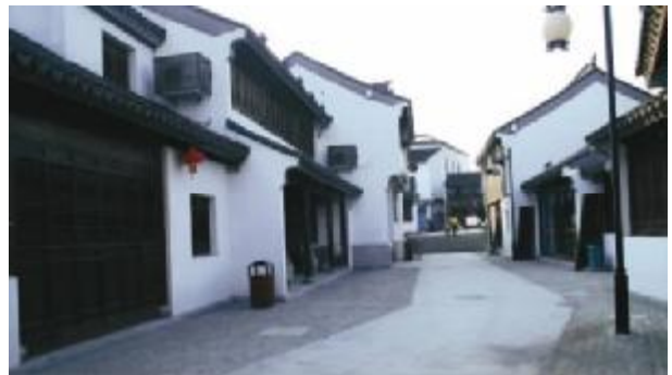
图5 白居易纪念地建筑群