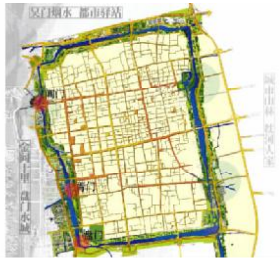
图 1 环古城总平面

1.2 历史文化挖掘的重点 因该区域在环古城地区中历史的份量最为重要, 历史遗存较多, 历史文献丰富, 同时又是城市重要的商业、办公和居住区, 规划处理好历史与现实、保护与建设、新与旧的矛盾关系, 突出苏州文化的精华。该地段有形成苏州地标性景观的潜力和要求。