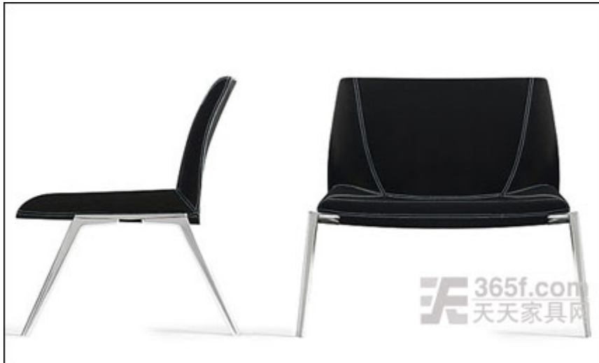
Plate 椅是由意大利设计师 Luca Nichetto 于今年为意大利 Kristalia 公司设计，并且在同年的米兰家具展中进行了展出。该座椅具有新颖独特的设计风格，并且其是通过精致的技术设计与传统手工艺相结合的方法制作而成。