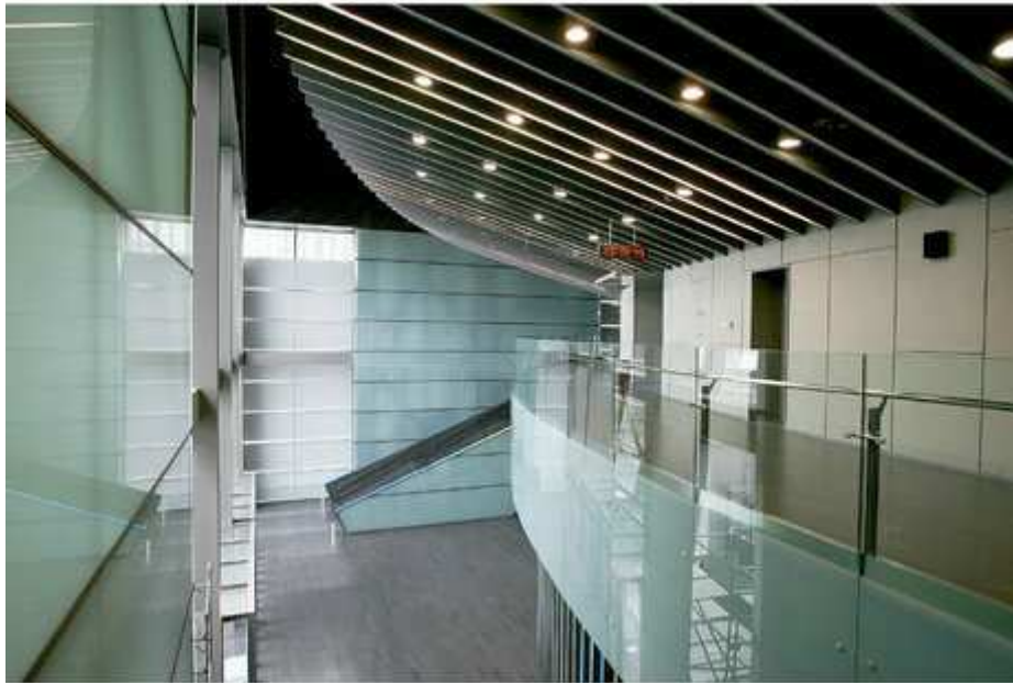
上下层观众集散大厅