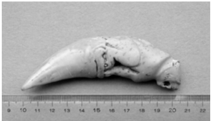
約1989年，筆者在地攤買到的一枚虎的上顎犬齒，猜測是華南虎的。