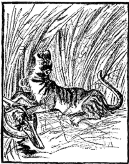
1899 年 11 月，瑞典探險家斯文赫定在新疆塔里木河沿岸所繪虎落陷阱素描。新疆虎現已滅絕。

流沿岸，胡楊林和蘆葦沼澤綿延不絕，棲息著無數飛禽走獸。根據《中國虎與中國熊的歷史變遷》，新疆虎曾分布南北疆，不限於塔里木河流域。約 100 年前，從喀什到阿克蘇，林中每隔一段距離，就有座用四根木樁架起的棚屋，供人天黑時過夜，以免虎害。