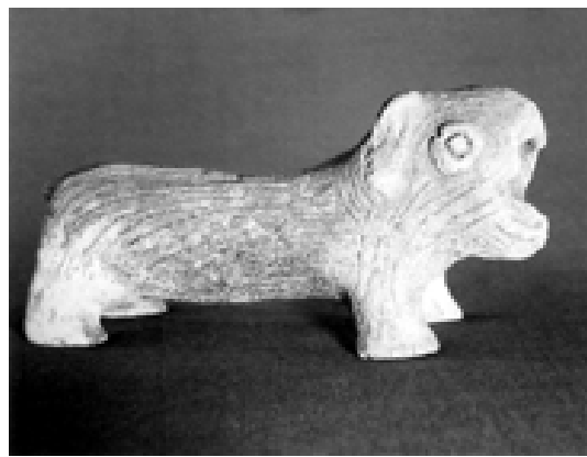
商周雕塑以虎為題材者甚多，除了文化意涵，也顯示當時虎多。圖為商代早期的陶虎。