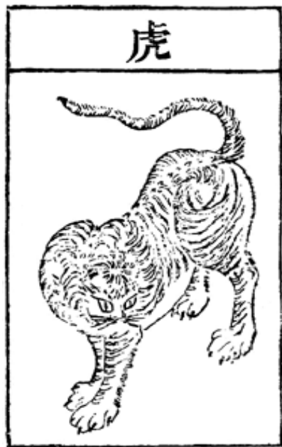
《本草綱目》的虎圖。據綱目，虎骨及肉、血等皆入藥。台灣自 1985 年起已禁止進口虎骨。