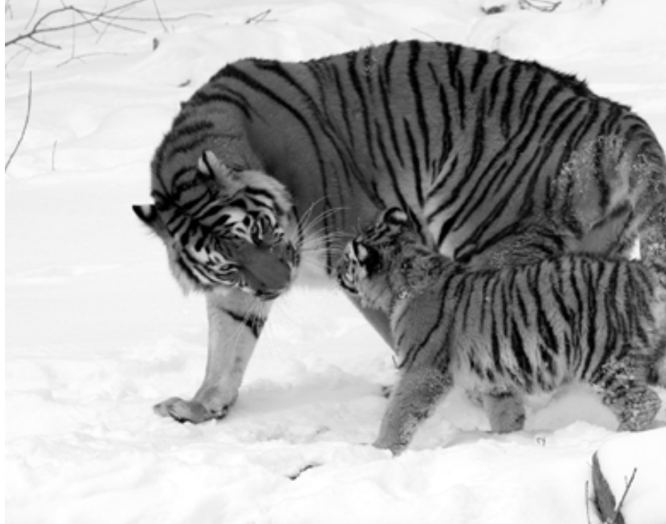
在各亞種中，東北虎體型最大，毛最長。此圖攝於美國水牛城動物園。

孟加拉虎分布印度、巴基斯坦、孟加拉、尼泊爾、不丹、緬甸等地，中國西藏山南地區據說也有少許。由於分布廣、數量多，加上印度人不殺生，當華南虎滅絕後，已成為數量最多的亞種。現今世界各動物園中的虎，絕大多數屬於孟加拉虎。台灣飼養