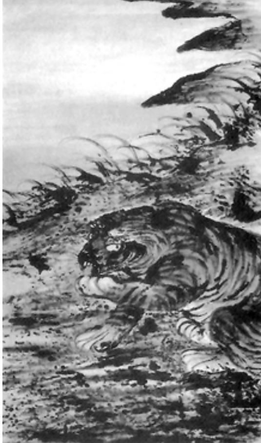
中國多虎，畫虎成為繪畫的重要題材。圖為清初指畫家高其佩《山君圖》。指畫是以指代筆的一種技法。

這次獵虎，大約發生在1920年代末，當時福建是日本的勢力範圍。葵川侯爵前往印度狩獵，途經廈門，聽領事說郊區就有猛虎，不禁心動，率同當地獵戶到山上搜捕。經山神廟的廟祝指點，「獵戶們在洞窟裡，在岩石縫隙間，到處搜尋，手裡掄著火把和鋼叉。侯爵站在大岩石上架著槍俯視四周。」