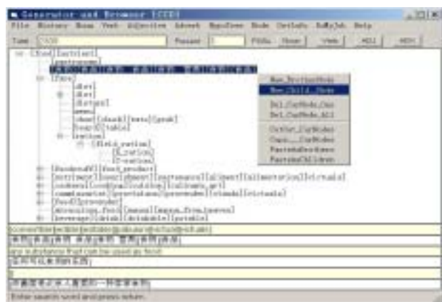
图 2 辅助词典构造软件 VACOL 的编辑界面

在项目组成员的大力协助下，作者经过近三年的研发，CCD 构造模型中涉及的两个核心问题都得到了很好的解决，用于构造 CCD 词典的可视化的辅助词典构造软件 VACOL (the Visualized Auxiliary Construction of Lexicon) 目前已具备雏形 [10] 。