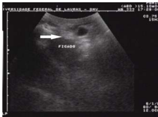
Figura 2. Imagem ultrassonográfica do fígado aos 11 dias após a realização de lobectomia hepática completa pela técnica de guilhotina modificada em um gato. Observa-se a hiperecogenicidade localizada sugestiva de tecido cicatricial no local da incisão e ligadura do parênquima (seta branca).

O exame ultrassonográfico possibilita a avaliação da estrutura do fígado, trato biliar e veia porta [20]. As imagens hepáticas no período pré-operatório mostravam-se com características ecográficas normais em todos os gatos, com ecotextura homogênea e discretamente mais grosseira que o baço, conforme descrições anteriores [10,18,19]. Aos 11 dias após a lobectomia, os fígados apresentavam-se ultrassonograficamente normais com uma área hiperecótica na região central, a qual pode ser decorrente do processo de fibroplasia por deposição de colágeno [14,17]. Na pesquisa, a hiperecogenicidade localizada era sugestiva de tecido cicatricial no local da incisão e ligadura do parênquima (Figura 2).