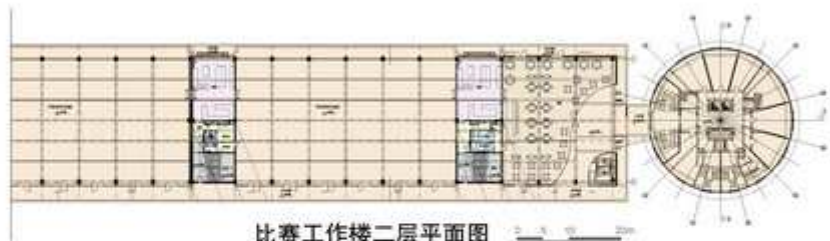
比赛工作楼二层平面图