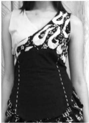
图 4 蓝印花布服装创新设计

南通蓝印花布现在通过对生产技术进行改进,已生产出适合现代人消费需求的具有弹性的蓝印花布、手感柔滑的丝质蓝印花布,这些具有新科技含量的蓝印花布设计的产品与其他地区的传统蓝印花布产品相比,有着更广阔的消费需求和市场前景。