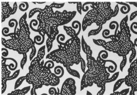
图 3 百蝶