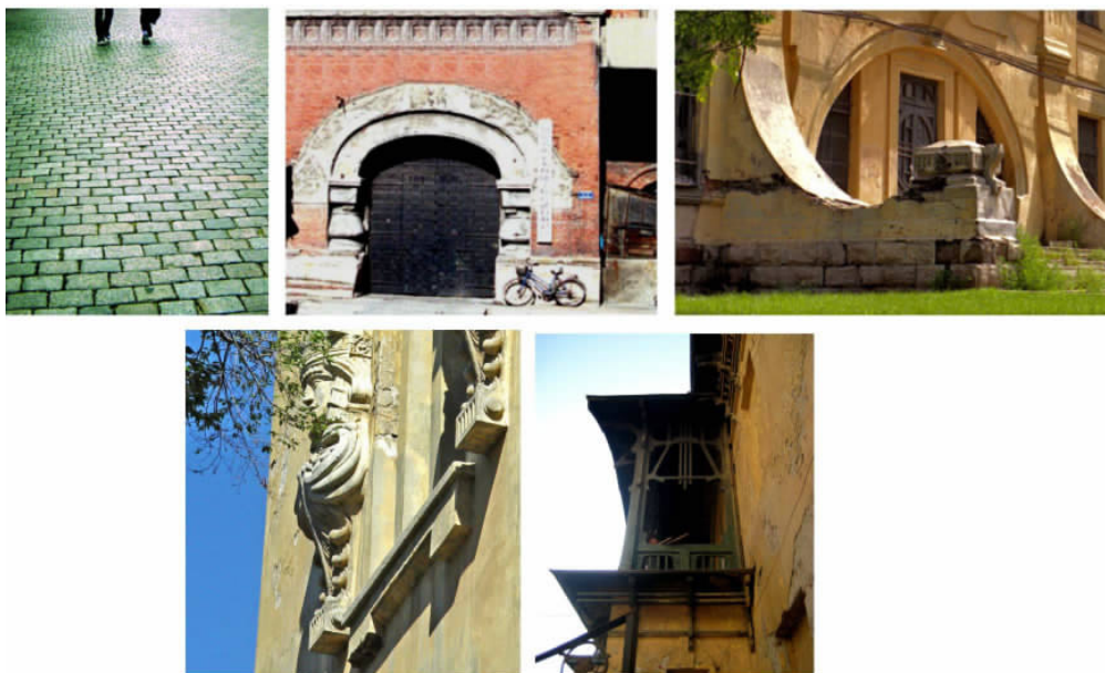
图 5 中东铁路沿线历史建筑的典型时空情节性景观:百年老石街和被风雨残蚀的老建筑片段

石、崖壁并非以它们材料颜色的面目出现,而是表面经过软化后达到的一种中间色调,能够与周围景物和谐地融合到一起” [4]165 。崇尚“苍老”审美意境的中国山水画一直被认作是中国传统“天人合一”生态哲学的艺术典范,看来,自然审美的历史感和原生态意象有着“通感”的品质,岁月、自然和中国人的怀旧情结能产生持久的共振。