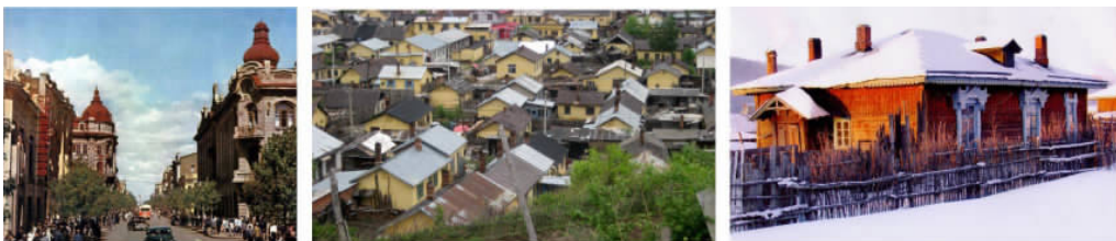
图 6 中东铁路沿线历史建筑的几种典型表情与场景:中央大街、横道河子镇、雪中站舍

展现了一种高度理性的“绿色哲学”——整体和谐观。俄罗斯族裔的建筑师和城市设计师们似乎是遵照着“家园”的设计理念来完成设计和建造的,而“家园”可以说是原生态的绿色人工环境。在中东铁路沿线,城镇环境一定是其中的建筑物有着相似的外部表情,无论是中心城市哈尔滨、小镇横道河子,还是一两栋单体建筑与周边环境形成的铁路站舍。建筑与环境之间的相似表情共同形成的清晰场景给人强烈的印象性。