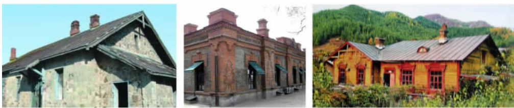
图2 中东铁路沿线历史建筑的几种典型技术形式:磊石建筑、砖砌建筑、木刻楞建筑

伴随着实实在在的材料选择和技术运用。中东铁路沿线历史建筑的墙体大多采用厚实的砖墙,最厚者甚至达到1.5米。开窗形式为竖向窄长窗,面积偏小以减小室内墙面冷桥的散热系数。级别较高的别墅和住宅专门设置阳光间,外部形式虚实对比,内部空间温暖明亮,创造形象的浪漫表情。普遍见诸中东铁路沿线建筑的坡屋顶巧妙地分解了雪荷载的压力,非常便于雨水和雪水的排放;而其下部通平吊顶的做法则是为了形成屋顶下的闷顶保温层。显然,这与今天盛行的表皮建筑及装饰性大屋顶表里不一的建造逻辑可谓天壤之别。