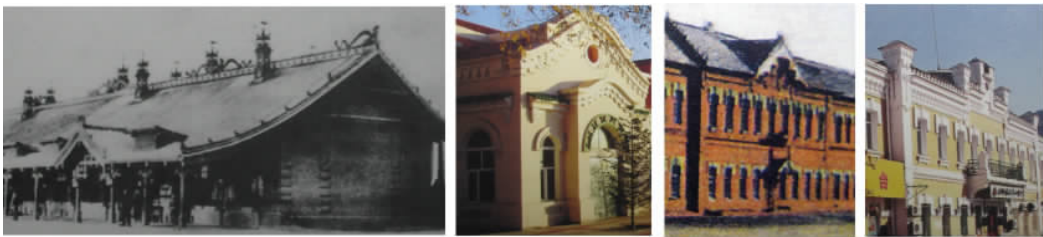
图 3 中东铁路沿线中西合璧的建筑景观演示了“局部同化”和“整体异化”的文化过程

转、和谐共生。最集中反映这种文化过程“局部同化”的建筑现象是存在于中东铁路沿线站舍建筑集群中大量的中西合璧式建筑作品。如图中实例可见,中式的屋顶和俄罗斯式的厚重墙面相应生趣,构成了绝无仅有的浪漫人文景观。随着历史的演进,大量的中式屋顶和檐下装饰逐渐被恢复成了与主体形象更趋一致的俄罗斯形式,演示了“整体异化”的文化过程。(见图 3)之后,同化和异化的过程交互作用,由此展现出的建筑景观也异常的丰富和富有戏剧性。集中在哈尔滨市埠头区(今道外区)的“中华巴洛克”风格四合院是最为突出的实例。砖石檐口、欧式窗洞周围缀满的“福禄寿”、“富贵吉祥”、“云纹花草”浮雕装饰;欧式砖墙前带有雀替的木柱式和围以根花格的敞廊;欧式建筑立面上挂满的中式楹联旗帜,各种风格迥异的建筑语言和样式交相辉映,构成一幅和谐动人的市井画卷(见图 4)。