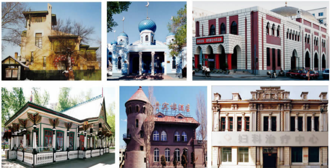
图 7 不同文化品味的历史建筑风格:新艺术运动、伊斯兰、犹太、俄罗斯田园、罗马城堡、中华巴洛克

尔滨,俄罗斯人、犹太人、波兰人、日本人等多族侨民都留下了自己文化的影子,而借助建筑表现得最为突出的是各类人群的生活方式和精神理念。数量和质量都位居世界前列的新艺术运动风格建筑展示了当时位居远东文化中心城市和艺术之都的前卫和浪漫;形式各异的教堂交相辉映,无声地宣告这座移民城市有着高度的精神文明;包括日本风格在内的多种休闲建筑沿松花江的斯大林公园依次散落,装点城市休闲生活的同时展现高度城市化的生活方式;商贾云集的商业区中国大街(现中央大街)洋味十足,堪称上流社会聚集的中心;中国民工商贩杂居的道外街坊满眼是中华巴洛克风格的随意拼贴组合,上演着社会底层的市井风情……这些林林总总的建筑遗产紧紧跟随着整个历史进程和时代风貌乃至社会阶层渐次展开,它们是那个时代和社会关系的代言人。从反映社会文化这一点上看,它们的作用是健康和强有力的,因此,在反映生活方式上堪称最准确的绿色建筑。