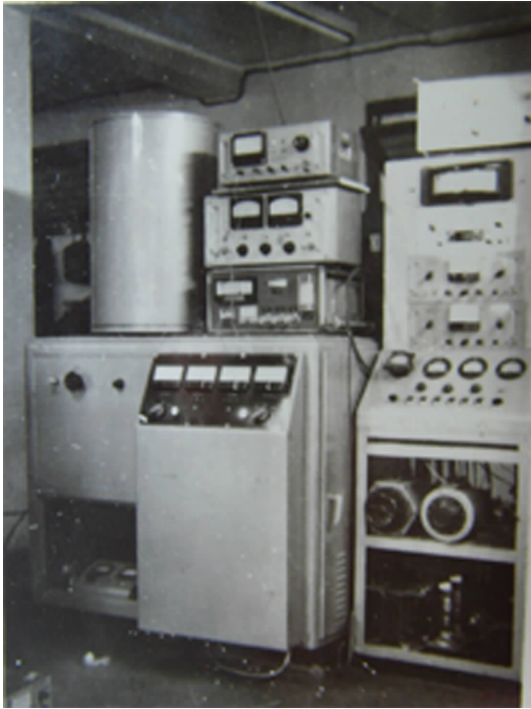
图3 上海天文台研制的我国第一台氢原子钟样机

图3为上海天文台研制的我国第一台氢原子钟的样机照片。1970年上海天文台成立了氢原子钟研制组,开展了氢原子钟的试制工作。氢原子钟的研制工作是一项涉及面广,工艺要求高,难度较大的综合性研究课题,有些工艺和技术还是国内第一次使用,如大面积石英涂银、抽超高真空用的无油冷钛离子泵等,