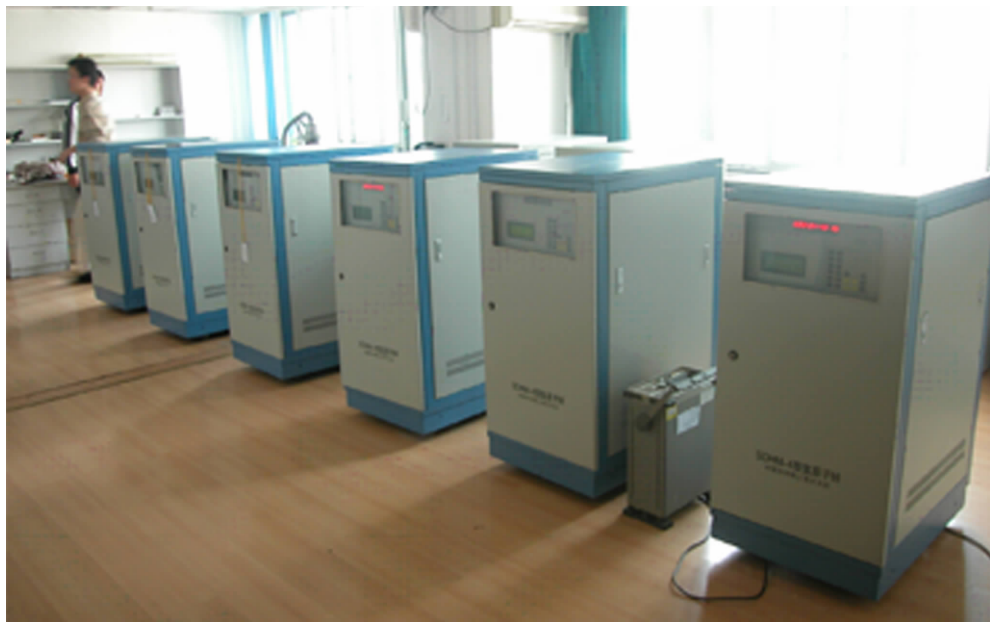
图 6 实用型氢钟整装待发

目前,实用型标准的性能指标:稳定度为 (2 \sim 4) \times 10^{-13}/s , (5 \sim 8) \times 10^{-15}/d ,准确度为 5 \times 10^{-13} 。图 6 为最近批量生产的这种实用型氢钟的实物照片。