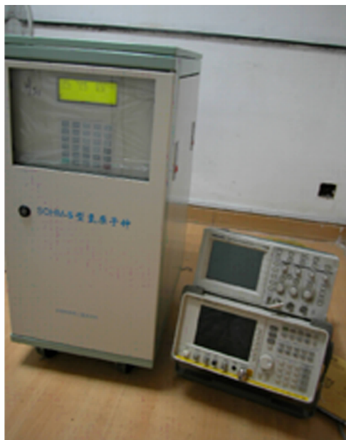
图 9 新型被动型小氢钟

采用蓝宝石谐振腔,可实现主动型氢钟的小型化,其重量可望只有 50 kg。凭借上海天文台大氢钟的成功设计准则和研究经验,研制小型化的蓝宝石腔主动型氢钟应该问题不大。目前国内已有蓝宝石腔的成功生产。研制出主动型小型氢钟,以满足地面用户的需求也必然具