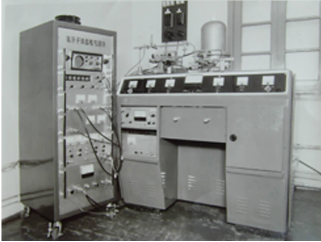
图2 上海天文台生产的氨分子钟

氨分子钟在上海天文台实验室试制成功后,准备试生产,扩展应用。于1972年试生产了四台新型氨分子钟。两台用于上海天文台时频发播系统,另两台用于陕西天文台的时频发播系统。图2为这种新型氨分子钟在系统中工作的照片 [2] 。其准确度为 1 \times 10^{-9} ,稳定度为 10^{-11} 。