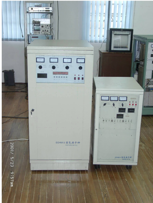
图 8 被动型小氢钟样机与主动型氢钟的比较

在国家项目的支持下,于 2003 年开始新一轮小型化被动型小氢钟的进一步研制,并进行了全新的设计,物理部分采用双真空系统设计,研制了小型类磁控管腔以及四极态选择原子束光学系统;并且设计和研制了分时调制数字化回路电子系统。这些全新的独特设计均具有很强的实用价值,为提高产品的性能做出了贡献。新型被动型小氢钟于 2005 年完成,并通过了专家组的验收。该小型氢钟的性能指标:频率稳定度为 2 \times 10^{-12}/\text{s} , 2 \times 10^{-13}/100\text{s} , (1 \sim 2) \times 10^{-14}/\text{d} ;频率准确度为 1 \times 10^{-12} ,重量为 30 kg。该种小氢钟研制了四台,图 9 为其实物照片。目前,其中两台仍继续在某计量单位运转,监测其长期性能。当前,上海天文台正在开展下一轮的更小型被动型氢钟的设计与研制。