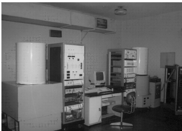
图 4 上海天文台实验室型氢钟

上海天文台在氢原子钟样机试制成功的基础上,对原设计进行了改进与提高,重新研制了改进型氢钟,于 1978 年投入使用,并在此基础上建立了我国第一个单台站原子时尺度。图 4 为当时上海天文台投入使用的氢钟。