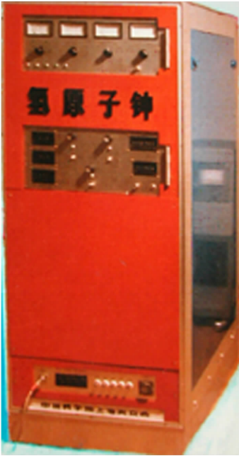
图5 我国第一台实用型氢原子钟

图5为我国第一台实用型氢原子钟的实物照片。该台氢钟从20世纪90年代初开始就在中国VLBI网佘山工作站使用。1998年经历一次复活改造后,连续工作至今,仍在继续使用。