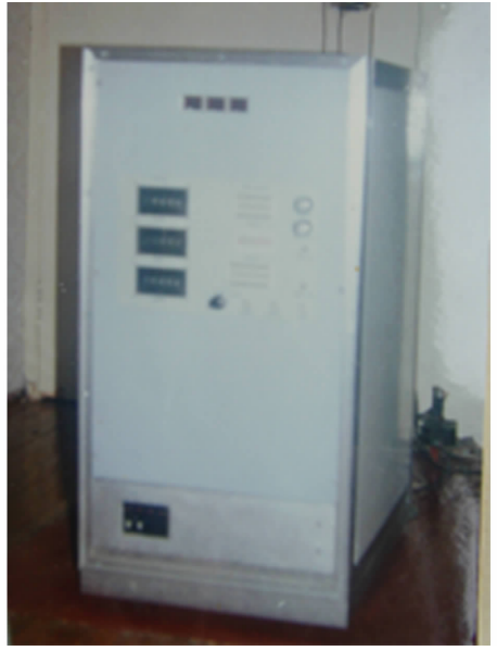
图 7 反馈振荡型小氢钟

上海天文台于 20 世纪 90 年代后期开始被动型小型氢原子钟的研制。其物理部分沿用曾经成功用于反馈振荡型小型氢钟的那套系统,只不过此时让其工作在被动状态,用作量子鉴别器用,配