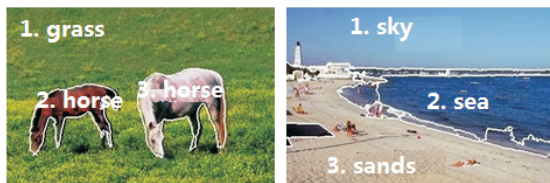
(a) “horse”对象语义 (b) “beaches”场景语义

该模型特别适合于图像中的“对象语义”分析问题。这是因为, 对象语义属于简单语义, 图像中的单个区域即能表达。如图3(a)所示, 图像中第2和第3个区域便能表示“horse”这个对象语义。