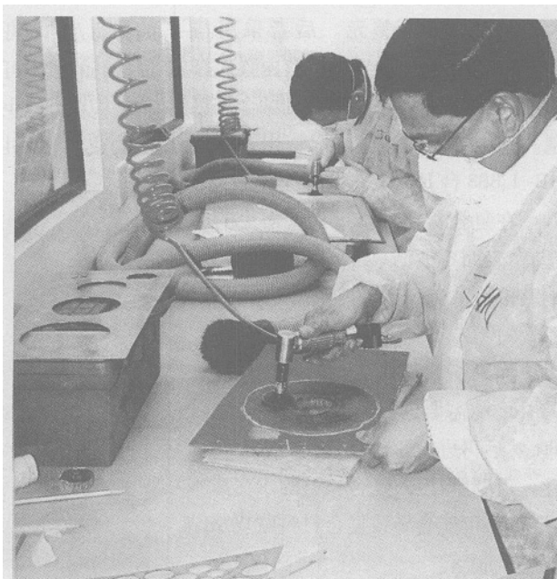
学员正在进行复合材料的打磨实习