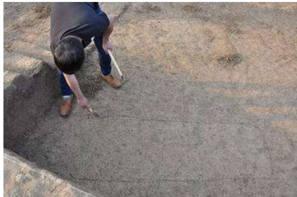
图四 考古工作照(区划墓框)