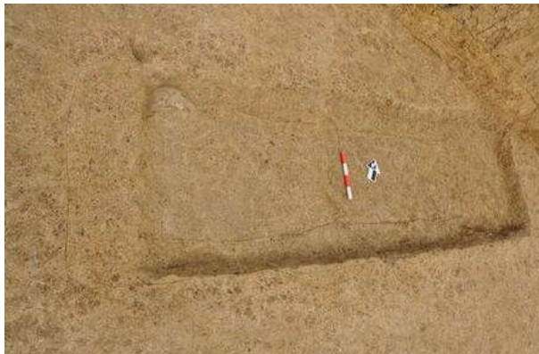
图九 M49所见二层台现象

2017年首批探方揭示出这七座史前墓，最重要的收获是首次发现了熟土二层台现象。编号M49的长方形土坑墓中，墓室内四周填土土质土色明显区别于中心区域，构成熟土二层台。M49墓长2.3米、宽0.65米，二层台内宽0.4米、长1.5米，呈长方形。判断当时已经使用了棺一类的葬具，葬具与人体在一定时间后腐朽归尘，墓葬填土下压，遂造成墓中间区域与周边填土不一致，即我们今天考古发掘揭示出的熟土二层台现象。