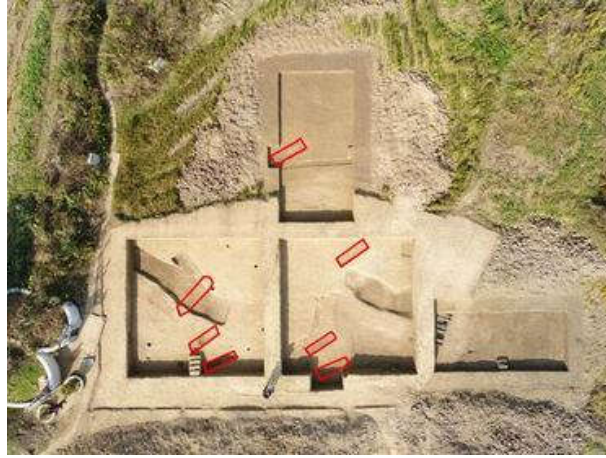
图三 2017年首批探方新石器时代墓葬分布

孙家岗遗址2017年度的发掘于10月18日启动，首轮发掘探方在遗址东部墓葬区，紧临16年发掘区向北布设10×10平方米探方两个和5×10平方米探方两个，实际总发掘面积248平方米。首批探方于11月9日完成全部发掘工作，先后揭示出七座新石器时代墓葬，出土陶器30余件，陶器器型以带领罐为主，另见有杯、盘、钵和鬲等。