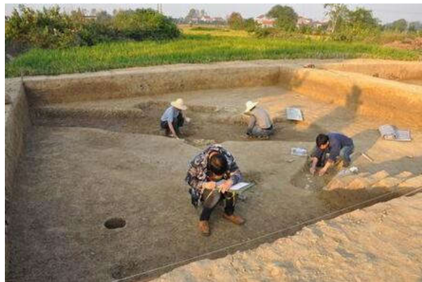
图五 考古工作照(绘图与墓葬清理)