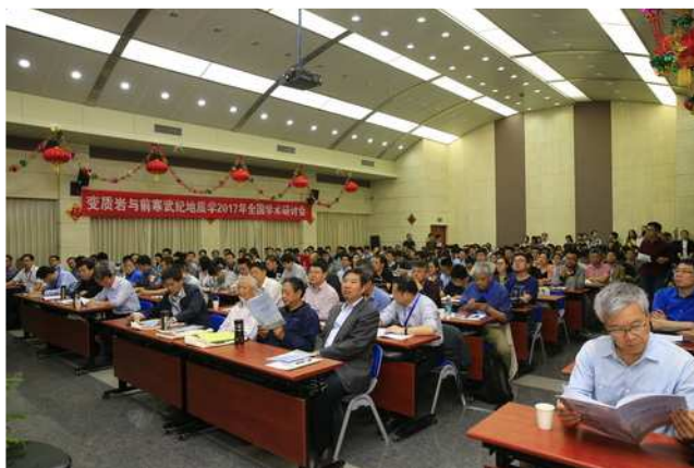
北京室内研讨会现场照片