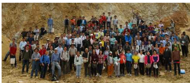
5月9日A、B两组参加野外考察的代表在内蒙古乌兰察布盟丰镇市红砂坝汇合