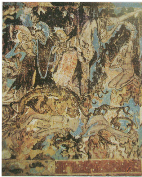
10-2 摩珂萨埵舍身饲虎图 壁画（北魏）