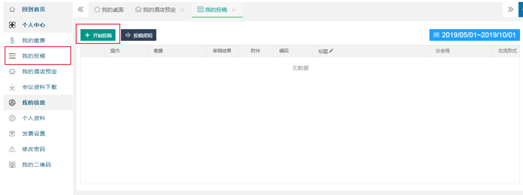
图 8-2 在线投稿