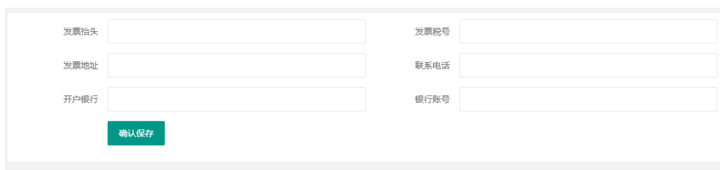
图 11 设置发票信息