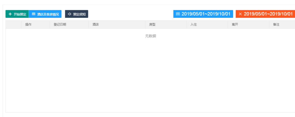
图 9-2 酒店预订