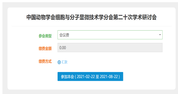
图 2 报名参会