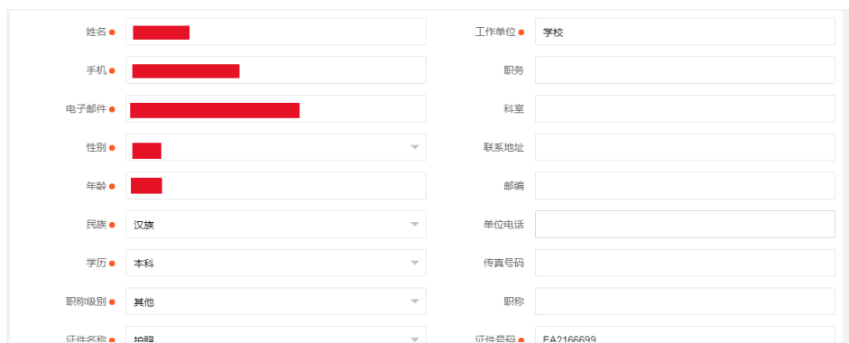
图 10 修改个人资料