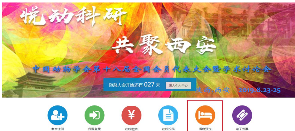
图 9-1 酒店预订