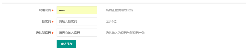
图 12 修改账户密码