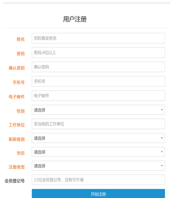
图 1 个人信息注册