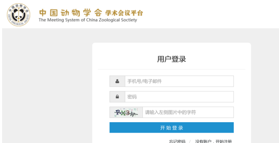
图5 会议平台登录窗口

2) 在弹出窗口(图5)输入用户名, 密码, 点击【登录】, 如果输入错误的密码则弹出错误提示, 若忘记密码, 请点击忘记密码, 按照提示找回密码。