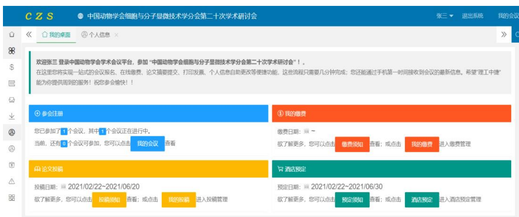
图 6 个人中心页